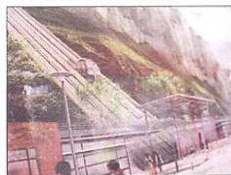
Le futur funiculaire

Il y a un siècle, la grande vogue était aux tramways électriques. Les trois villes sœurs n'ont pas échappé à ce phénomène. A partir de la ligne qui reliait Le Tréport, Eu et Mers, les élus avaient prévu une ligne se prolongeant jusqu'aux hauteurs de la falaise. Techniquement l'affaire se révèle trop compliquée, la dénivellation est trop forte par la rue de Paris, et une ligne passant route de Dieppe serait plus facile, plus sûre mais trop onéreuse. Le projet reste dans les cartons.